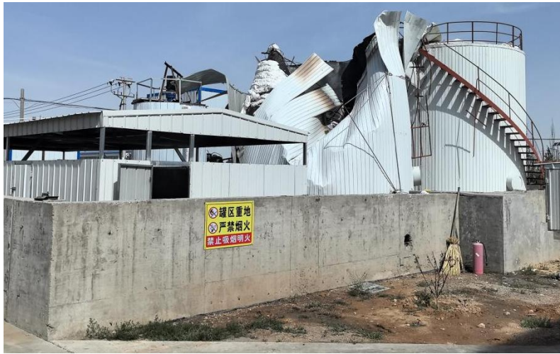
图 3: 发生事故后罐区损坏情况